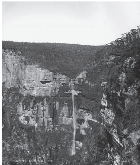
Abb. 2 Historische Aufnahme der Blue Mountains (um 1900). Von einer Klippe des Govett's Leap sprang Childe am 19. Oktober 1957 in den Tod.

zur persona non grata erklärt, und ihm wurde die Einreise in die Vereinigten Staaten verweigert. Nicht zuletzt passt auch sein Ende zum Leben dieses ungewöhnlichen Mannes: Kurz nach seinem Ausscheiden aus dem Universitätsdienst und seiner Rückkehr nach Australien, stürzte er sich in den Blue Mountains nahe Sydney am 19. Oktober 1957 von einer Felsklippe (Abb. 2).