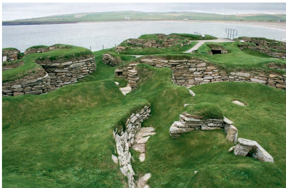
Abb. 3 Zu den berühmtesten jungsteinzeitlichen Siedlungen Nordeuropas zählt auch der von Childe untersuchte Ort Skara Brae auf den Orkney-Inseln. Da Holz auf den Inseln Mangelware war, wurden die Häuser aus lokalem Stein errichtet.

Von der Vielzahl seiner theoretischen und methodischen Ansätze – so ergänzte er in den 40er Jahren sein Konzept der «Revolution» durch ein Stufenmodell, das vom «Wildenda-