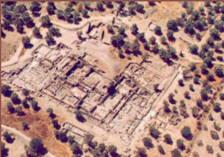
Abb. 30 Gortyn. Blick von Südosten auf die freigelegten Ruinen des Prätoriums. In der ungefähren Blickrichtung entspricht diese Luftaufnahme aus den 1970er Jahren dem oben stehenden Plan.